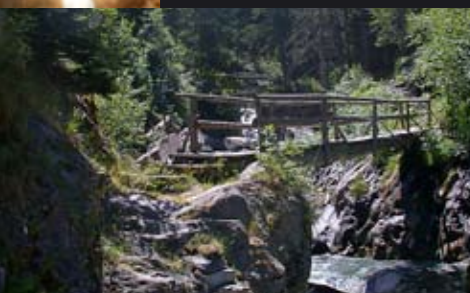
Taverna / Stockalperweg