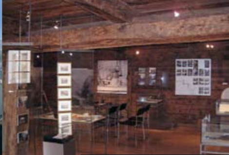
Ecomuseum Simplon Dorf