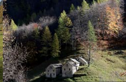
Rosi / Zwischbergental