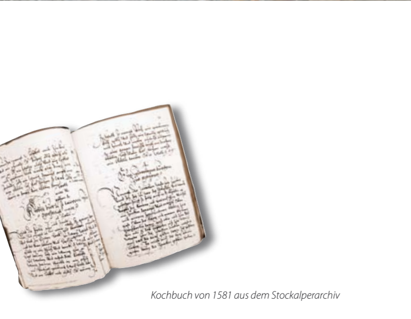
Kochbuch von 1581 aus dem Stockalperarchiv