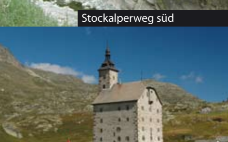
Simplonpass altes Hospiz