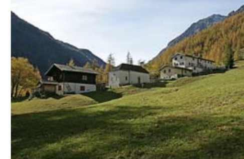
Bord / Zwischbergental