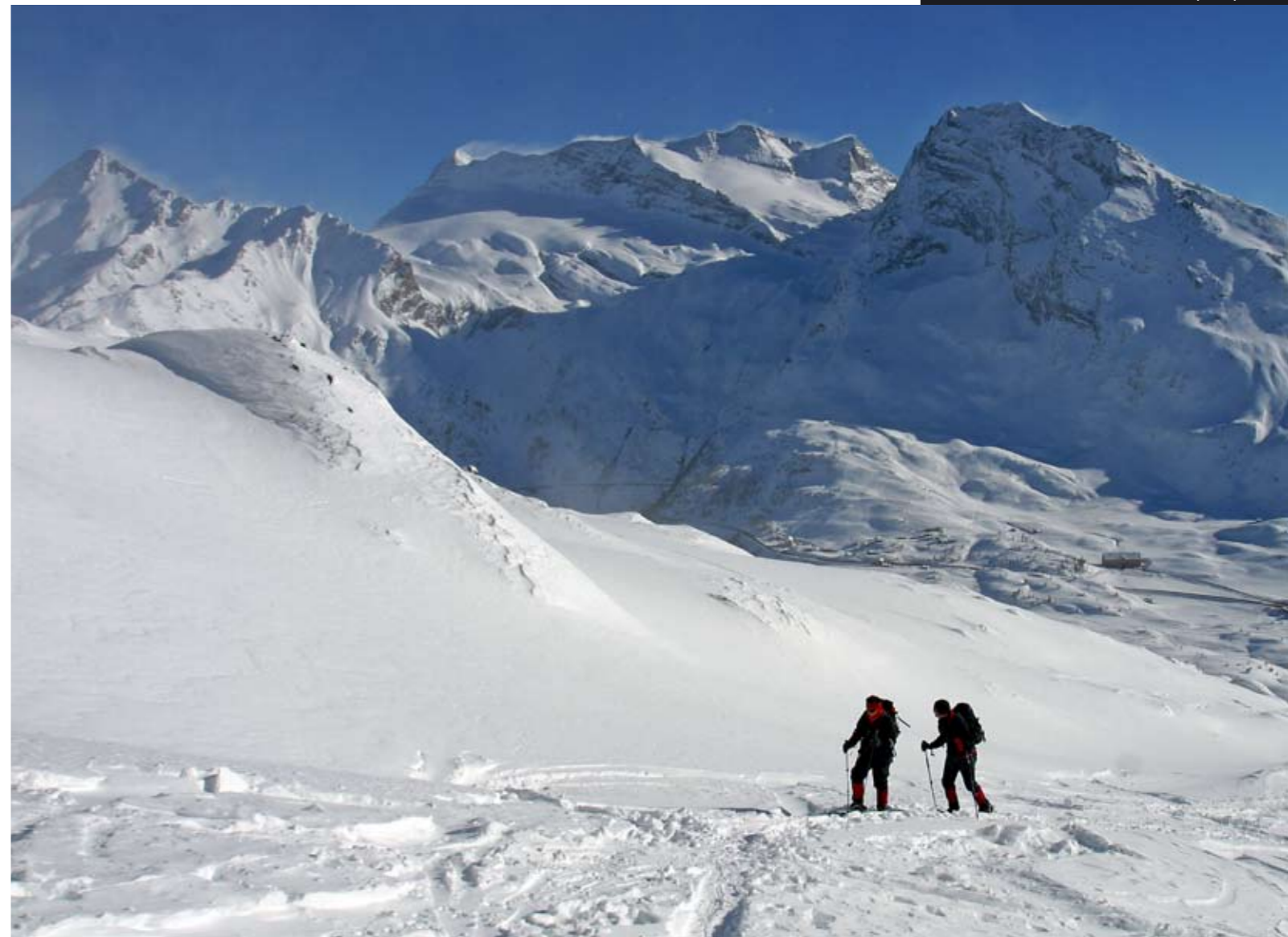
Schneeschuhlaufen oberhalb Simplonpass