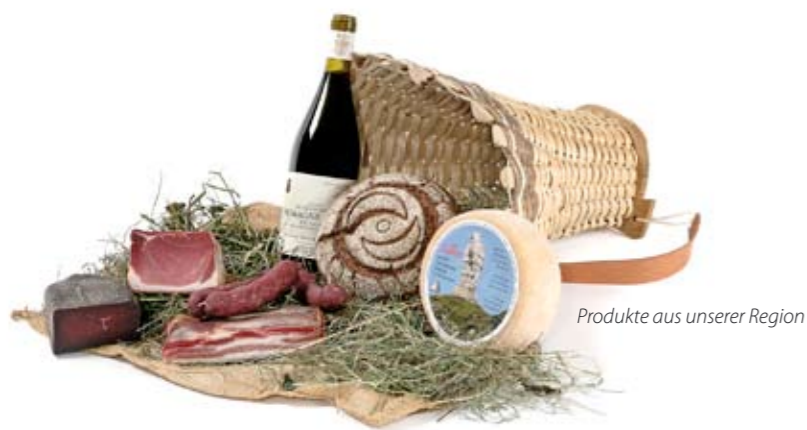
Produkte aus unserer Region

Zafferano, timo alpino e insalata dell'orto per i piaceri della tavola: una cucina che non cede alle tendenze esotiche, ma che resta radicata alla tradizione regionale riproponendo in chiave leggera antichi sapori. Anche gli ingredienti semplici e tradizionali, reinterpretati con un pizzico d'innovazione, possono favorire l'aggregazione a tavola. Il forno del ristorante al piano terra rimane acceso e in uso tutto il giorno; la sala da pranzo viene preparata con cura per ogni tipo di evento. Un ristorante che rende ogni giorno speciale.