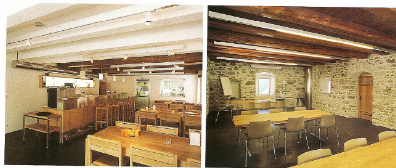
Sopra: la trasformazione dell'antica torre in moderno hotel per eventi e seminari. Pag. 90, la torre Stockalper dopo la ristrutturazione; pag. 92, veduta su Gondo dalle alte pareti circostanti; pag. 93, spogliature su Gondo e il costume walsert tradizionale; pag. 94, le antiche stalle dello Stockalperturn trasformaite in luogo di convivialità.

stesse emozioni dei viaggiatori di oltre un secolo fa. Emozioni suscitate da un paesaggio orrido e grandioso che gli automobilisti moderni non scorgono più perché la strada corre protetta da gallerie e paravalanghe. Ma le gole di Gondo esistono ancora e un breve cammino permette di visitarle. Il percorso costituisce un tratto dello Stockalperweg, il sentiero che ripercorre la "strada del sale" realizzata da Kaspar von Stockalper. Oggi tutta la valle del Sempione è uno straordinario ecomuseo ai piedi di rocce e alte montagne. Ad Alte Kaserne nella vecchia caserma di età napoleonica è stato allestito un museo (è sempre aperto e videosorvegliato dal posto di dogana di Gondo) che racconta con brevi testi e grandi