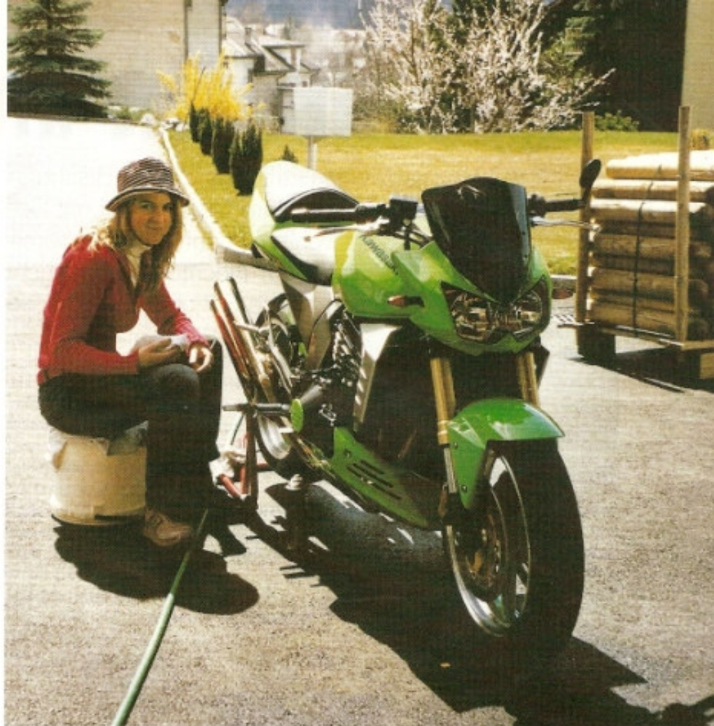
Motorradfahren ist die ganz grosse Leidenschaft der 33-Jährigen.