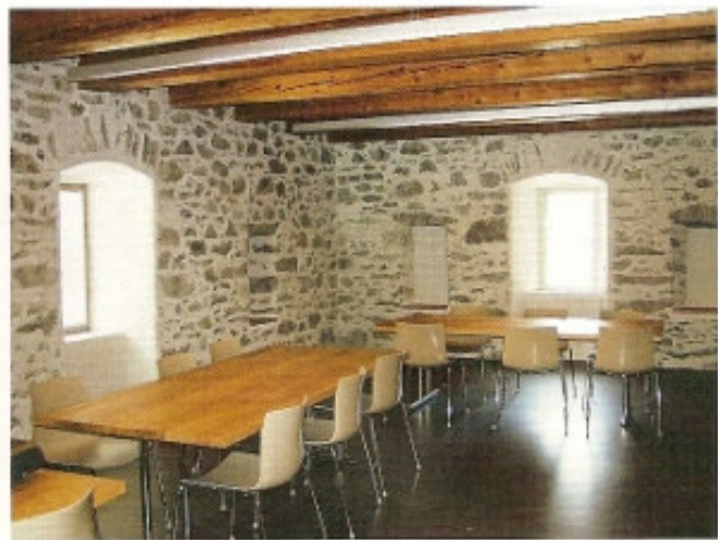
Das Hotel besticht durch alte Architektur in Verbindung mit modernem Zeitgeist.